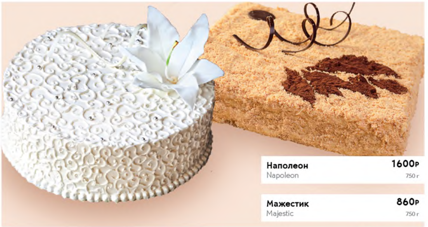
Наполеон 1600Р Napoleon 750 г