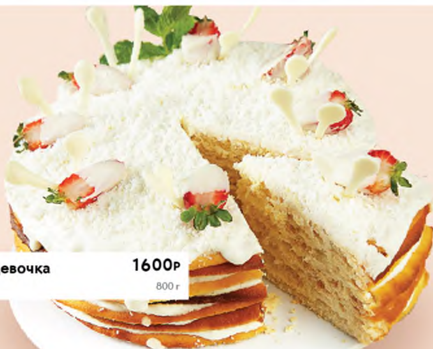
Молочная девочка Milkmaid