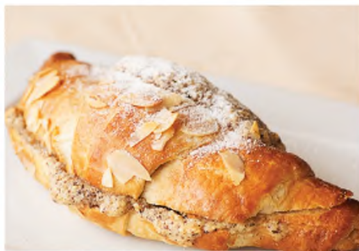
Горячий круассан с миндально-сливочной начинкой 120Р Hot croissant with almond creamy sauce 70 г