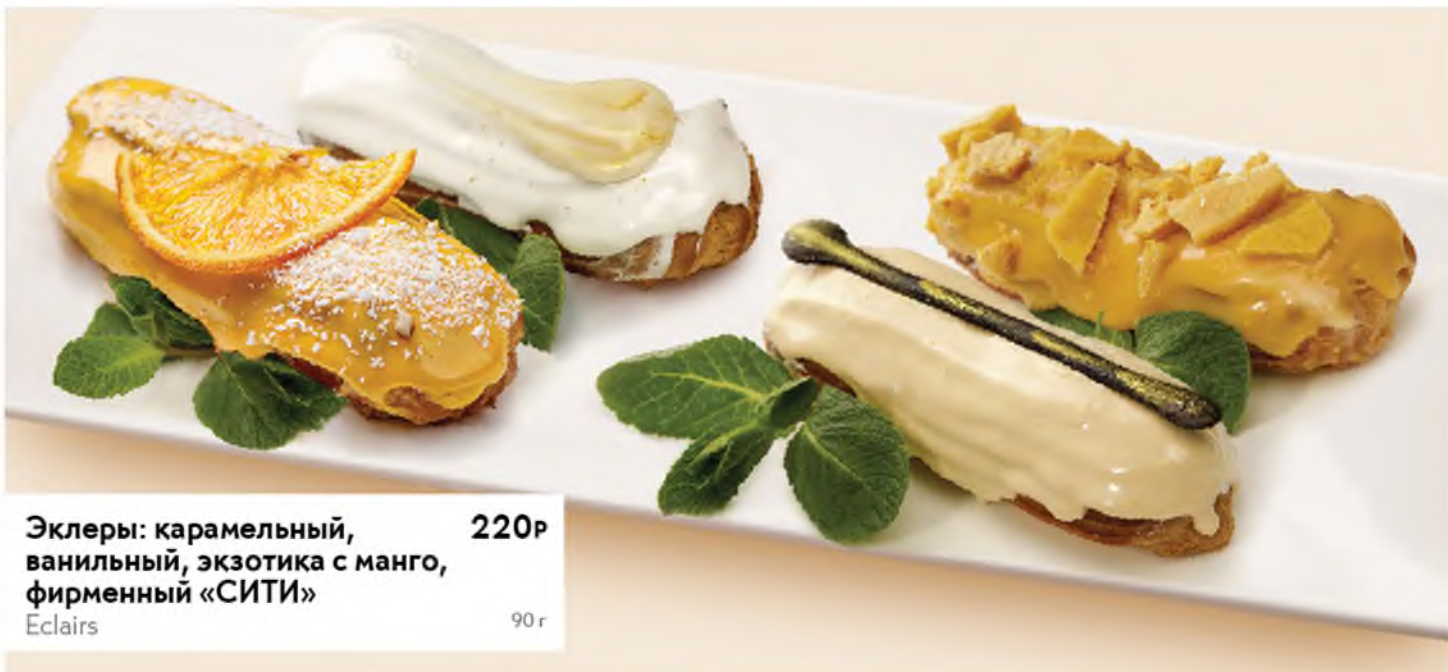
Эклеры: карамельный, ванильный, экзотика с манго, фирменный «СИТИ» 220Р Eclairs 90 г