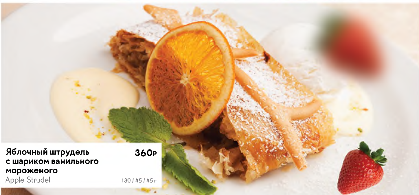
Яблочный штрудель с шариком ванильного мороженого Apple Strudel