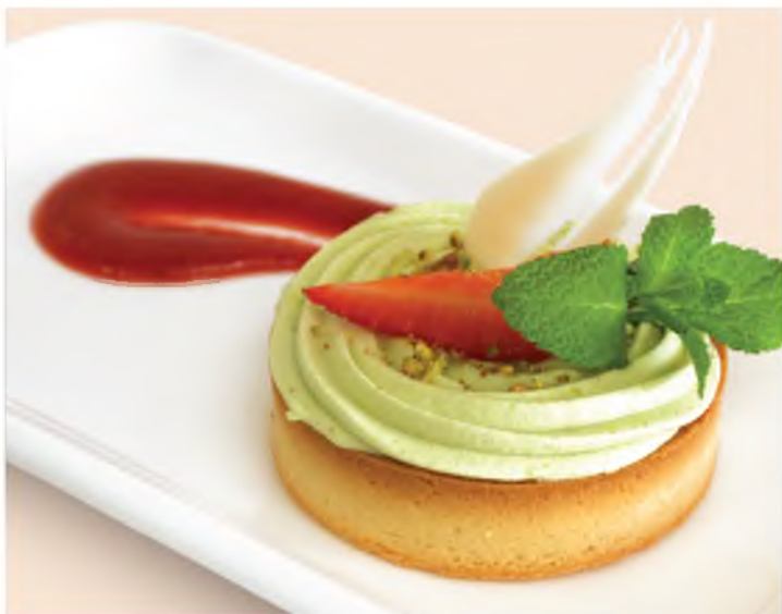
Тарт фисташка-малина Pistachio-raspberry tart