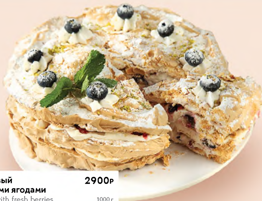
Меренговый со свежими ягодами Meringue with fresh berries