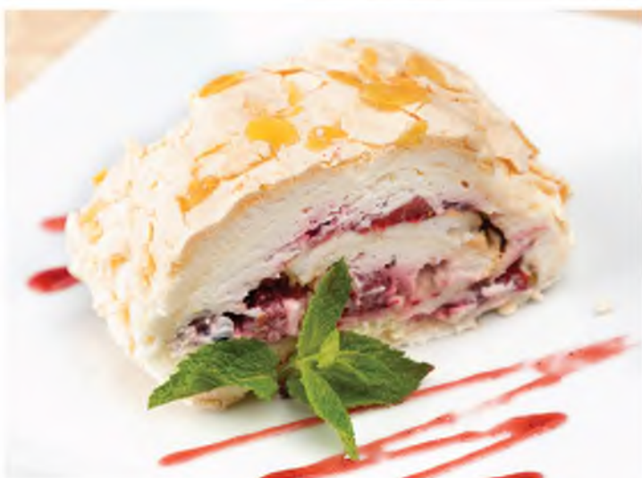
Меренговый десерт со свежими ягодами Meringue roll with fresh berries