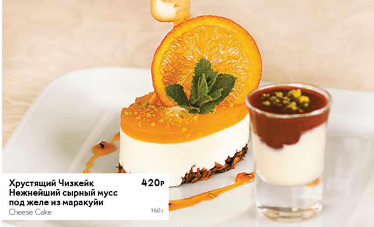
Хрустящий Чизкейк Нежнейший сырный мусс под желе из маракуйи Cheese Cake