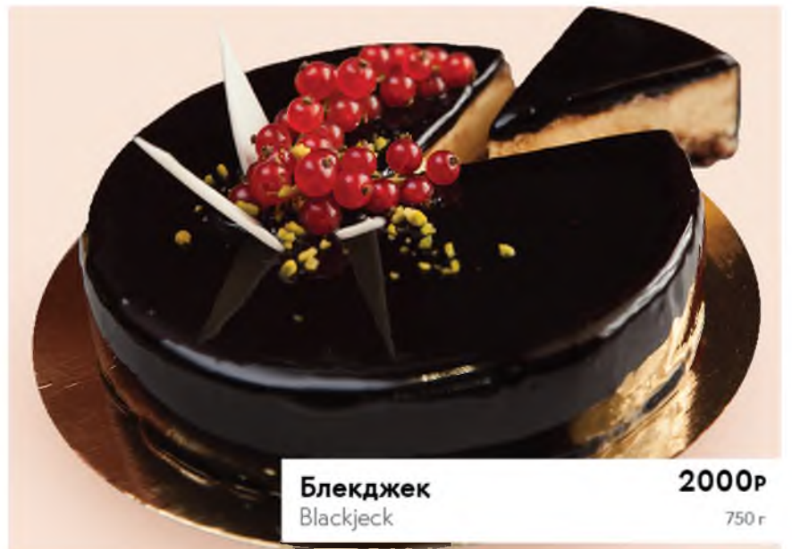
Блекджек 2000Р Blackjeck 750 г