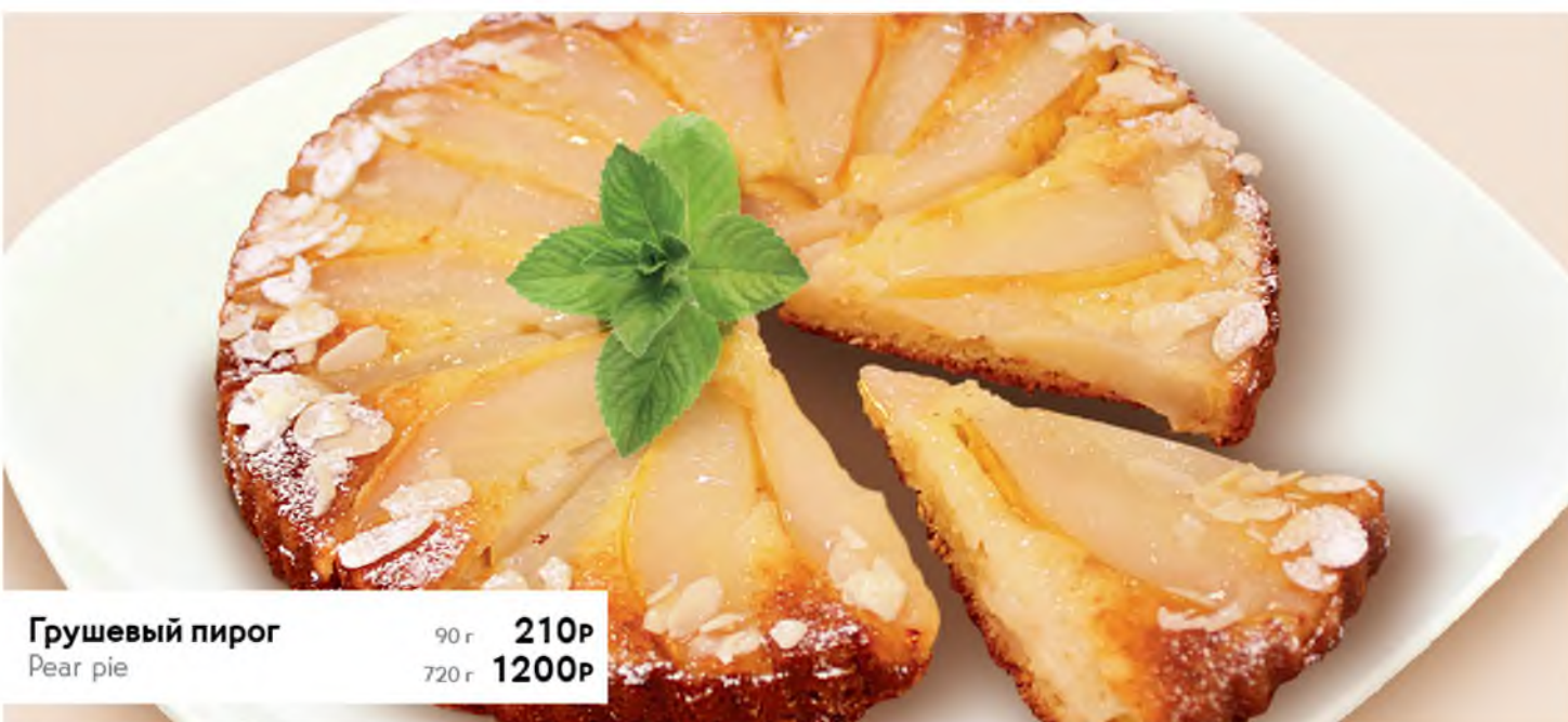
Грушевый пирог Pear pie