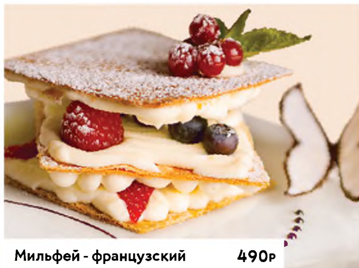
Мильфей - французский десерт со свежими ягодами и хрустящими коржами French dessert with cream and fresh berries between the cakes