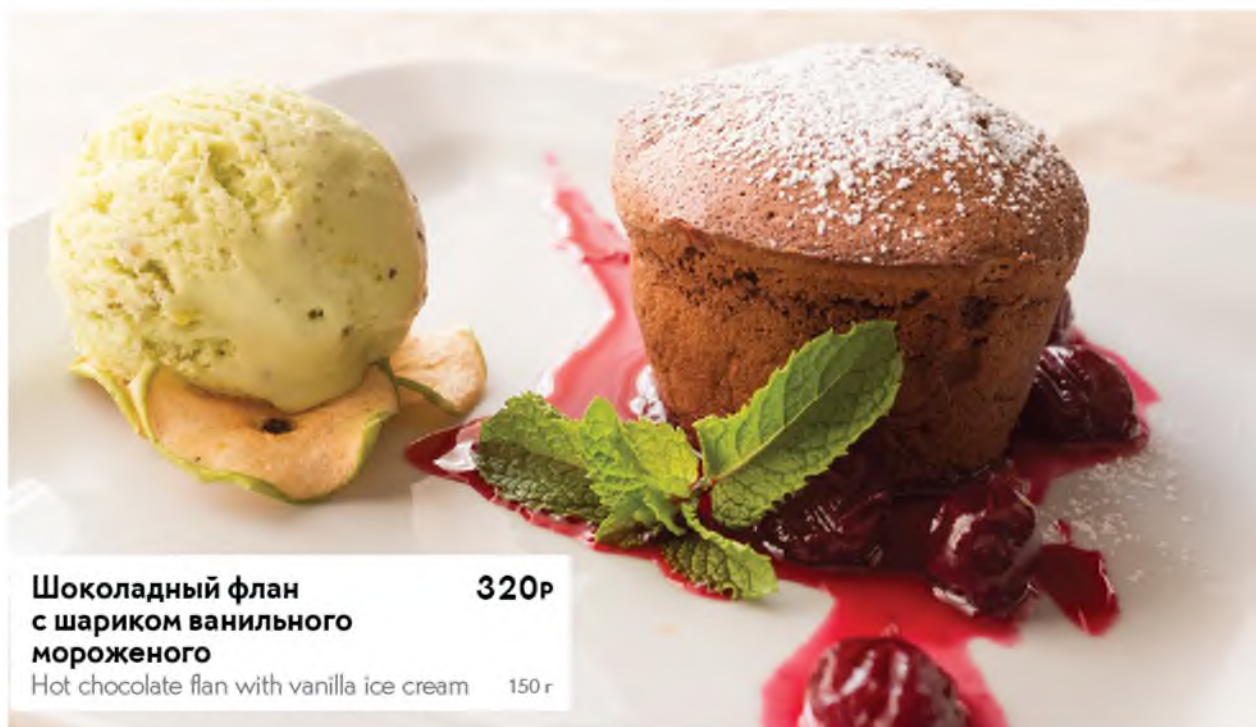
Шоколадный флан с шариком ванильного мороженого