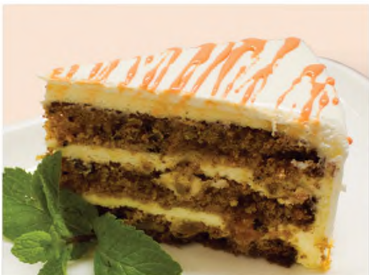
Морковный торт с кремом чиз Carrot cake with cream cheese