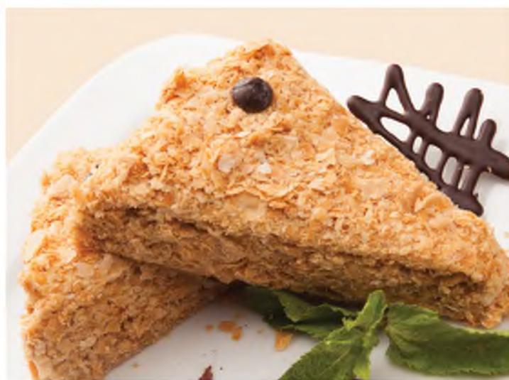
Наполеон - тонкие слоеные коржи с воздушным кремом Puff pastry cakes with cream