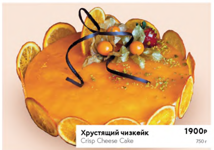
Хрустящий чизкейк 1900Р Crisp Cheese Cake 750 г

ПРИЕМ ЗАКАЗОВ: 8 (800) 201-35-49 / 8 (915) 088-31-26