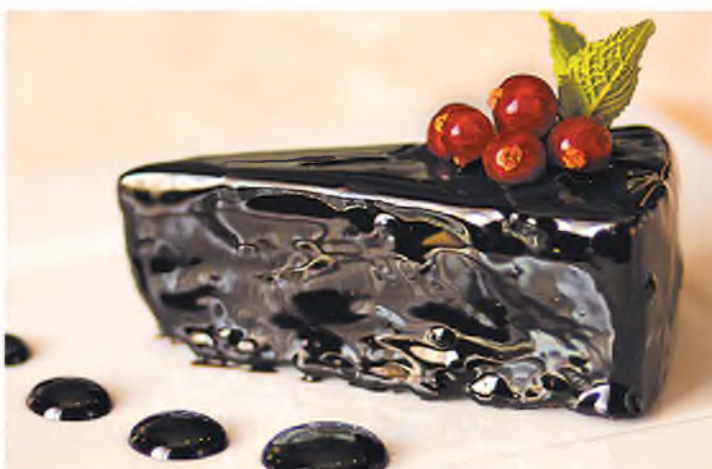
Блекджек - неповторимое сочетание воздушного мусса в шоколадной глазури 290Р Cake Blackjack 90 г