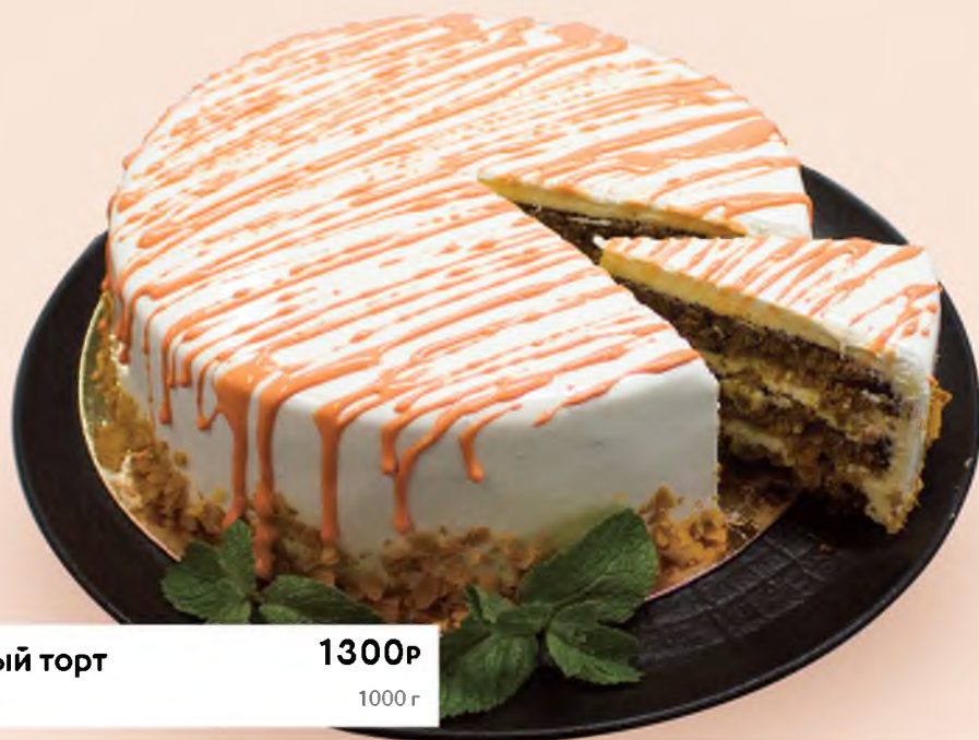
Морковный торт Carrot cake